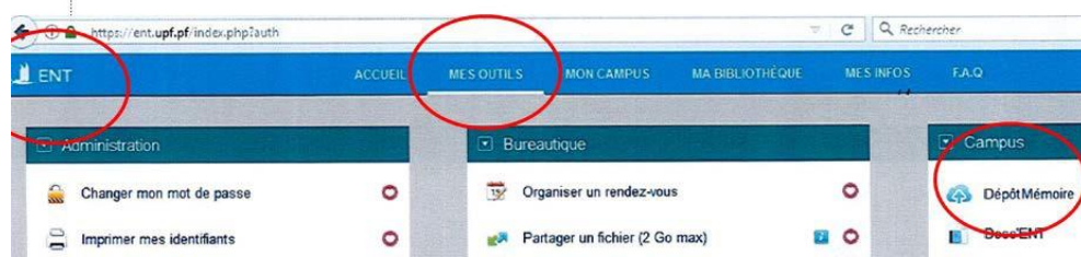
Figure 1 : Capture d'écran de l'ENT, indiquant le positionnement de la plateforme DépôtMémoire