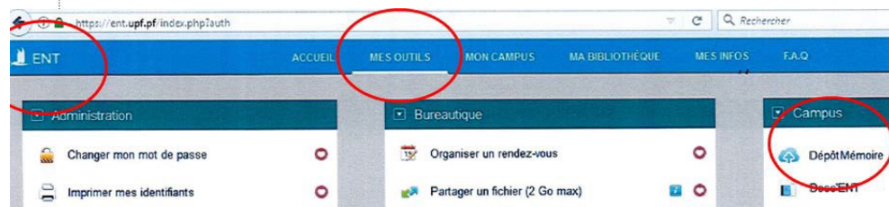
Figure 1 : Capture d'écran de l'ENT, indiquant le positionnement de la plateforme DépôtMémoire