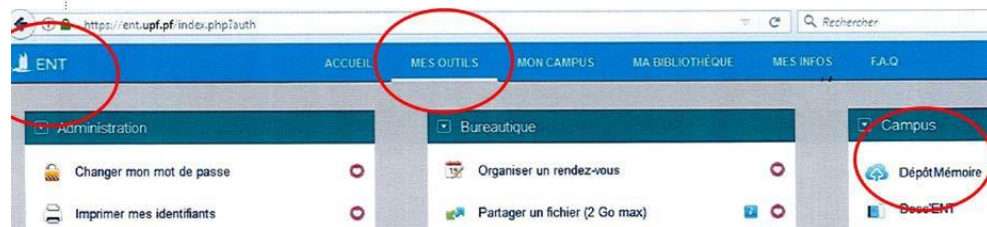
Figure 1 : Capture d'écran de l'ENT, indiquant le positionnement de la plateforme DépôtMémoire